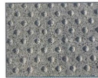
Gris Amor 10