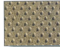
Jaune type Sautron