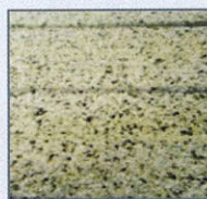
Gris ARMOR 10

Le rail de guidage Armor granité est un élément préfabriqué constitué d'une agglomération de résines synthétiques de type méthacrylate et de granulats de roches naturelles (marbre et quartz en granulométrie 0,6/1,20) en pleine masse et en surface.