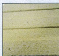
Blanc ARMOR 9